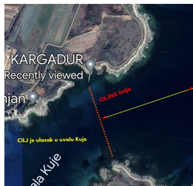
Slika br.2 - Cilj